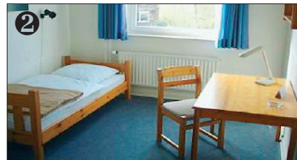
Wohnräume / Accomodation.