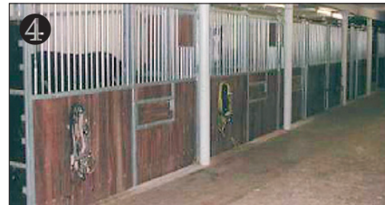
4 Stall / Stable.