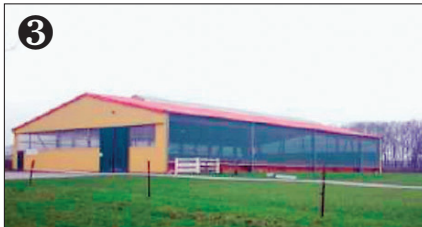
3 Reithalle 20 x 60 / Aussenplatz. Covered riding arena 20 x 60 / riding area.