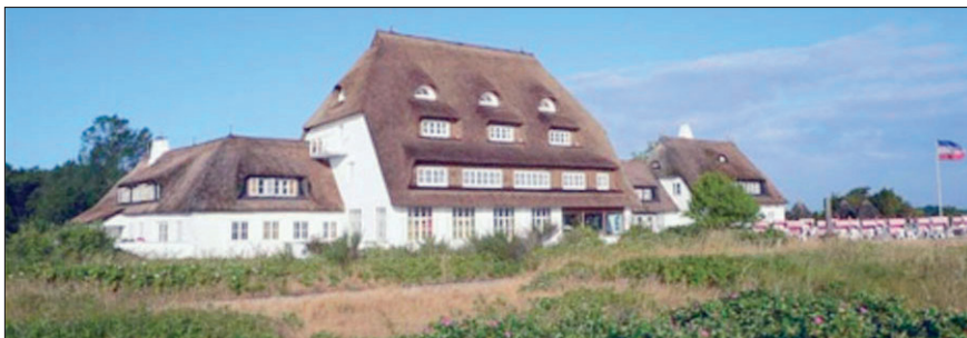
Hotel «Genueser Schiff» ( www.genueser-schiff.de )