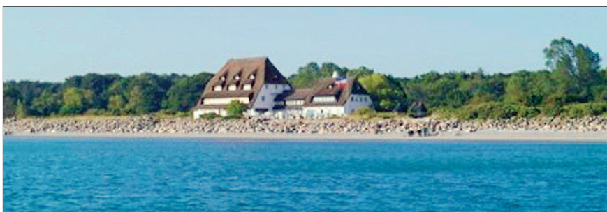
Hotel «Genueser Schiff» ( www.genueser-schiff.de )

ISG Delegierten-Versammlung in Futterkamp an der Ostsee, Deutschland, 12. bis 14. Juni 2009. In Zusammenarbeit mit den Zuchtverbänden VZAP, ZSAA, SShF, DSAH und NHAf. Die Delegierten-Versammlung findet in der Lehr- und Versuchsanstalt in Futterkamp an der Ostsee statt.